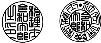
18mm 18mm 丸印タテ 丸印

※形について、通常は天角仕様となります ※素材についてはホームページ等でご確認ください ※素材によっては取扱いのないサイズがあるのでお問い合わせください ※書体については基本テン書体となります その他の書体での作成も可能です